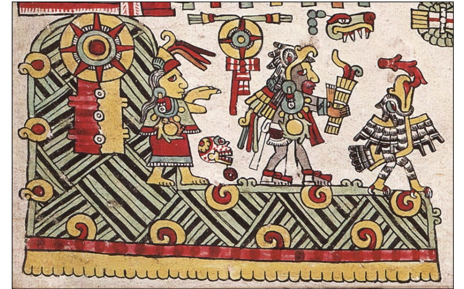
Figura 6.5. Discos solares emergentes en el códice Nuttall, p. 21; Museo Británico. Fotografía: Trustees for the British Museum, ET Am1902, 0308.1, Add. Mss. 39671.

rastro de sangre, a partir de un edificio humeante marcado con rayas rojas (Figura 6.4; Anders et al. , 1992: 148; Boone, 2000: 90, 94; Furst, 1978: 216, 219-220). Uno de estos discos incluso lleva el signo del día 1 Flor, el mismo nombre, quizá no por coincidencia, utilizado por “1 Ajaw [Flor],” uno de los Gemelos Heroicos de los mayas del período Clásico, quien es el prototipo del gobernante. El otro disco del códice de Viena muestra al Dios Solar de los mixtecos. El códice enfatiza además el papel de las parejas creadoras, un patrón que recuerda al par que aparece en la crestería del Templo del Sol Nocturno (Boone 2000: 91-92, fig. 47).