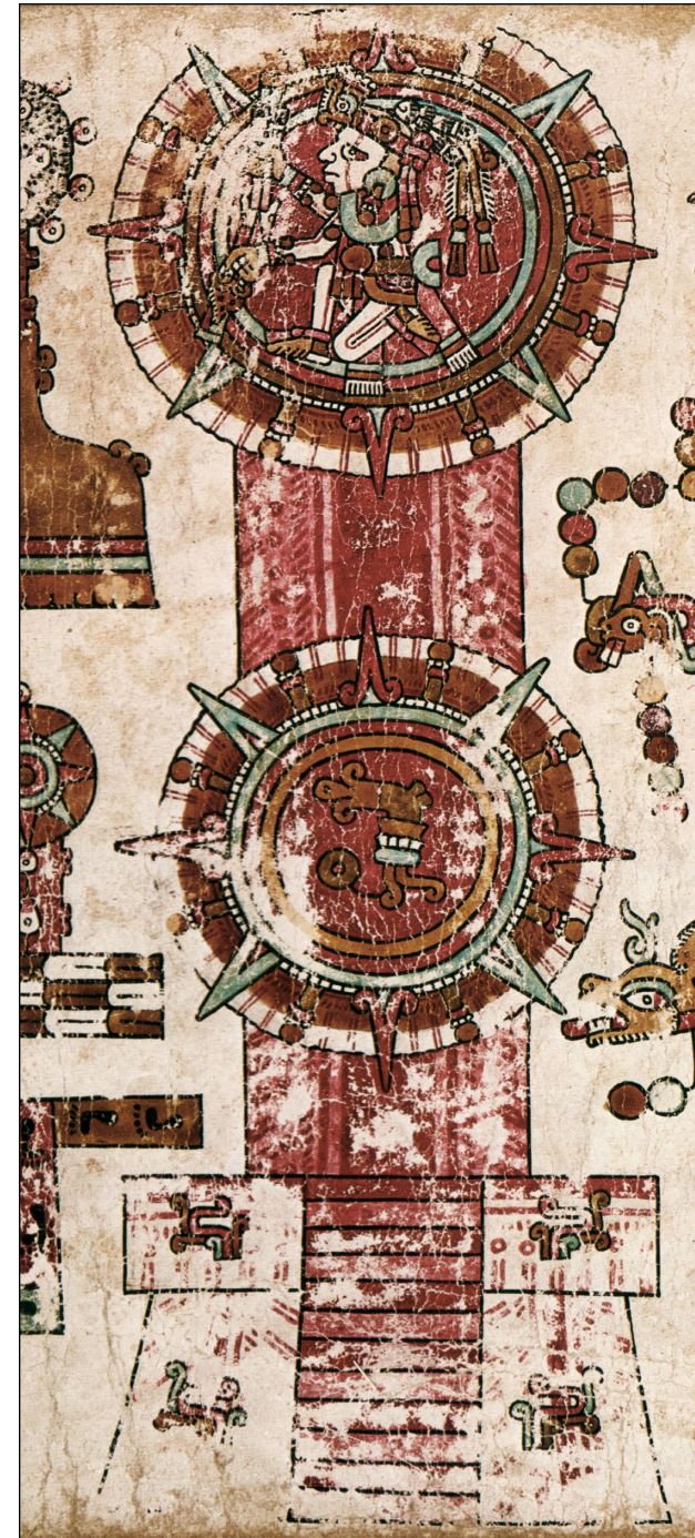
Figura 6.4. Discos solares en el códice de Viena, p. 23; Österreichische Nationalbibliothek (Biblioteca Nacional de Austria), Viena.

Aunque muy alejados en tiempo y espacio, existen paralelos significativos en las fuentes mixtecas del período Postclásico en Oaxaca, México, así como en regiones culturales próximas, algunas de ellas hablantes de náhuatl, en tanto que otras se extienden hasta las tierras altas de Guatemala (Chinchilla Mazariegos, 2013; Díaz Balsera, 2008; Jansen, 1997). En estas áreas, el nacimiento de nuevas dinastías se fundía con imágenes de soles nacientes, tiempos de oscuridad ahora iluminados por lenguas de fuego. Algunos de estos soles levitaban sobre templos sangrientos. En la página 23 del códice de Viena, por ejemplo, hay discos solares que se alzan, dejando un