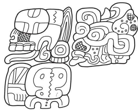
Figura 6.3. Estela 31 de Tikal (G5-G6). Dibujo: Stephen Houston.

Aunque muy alejados en tiempo y espacio, existen paralelos significativos en las fuentes mixtecas del período Postclásico en Oaxaca, México, así como en regiones culturales próximas, algunas de ellas hablantes de náhuatl, en tanto que otras se extienden hasta las tierras altas de Guatemala (Chinchilla Mazariegos, 2013; Díaz Balsera, 2008; Jansen, 1997). En estas áreas, el nacimiento de nuevas dinastías se fundía con imágenes de soles nacientes, tiempos de oscuridad ahora iluminados por lenguas de fuego. Algunos de estos soles levitaban sobre templos sangrientos. En la página 23 del códice de Viena, por ejemplo, hay discos solares que se alzan, dejando un